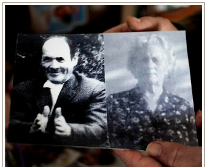
Dios, su padre y su madre son lo más grande del mundo