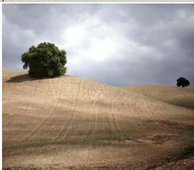
El llanto de la tierra y de la naturaleza

Él piensa que " la naturaleza debería ser libre porque la naturaleza no es de nadie. Pero entonces volvemos a los intereses y los interesistas, porque los estados invierten en intereses. Y la globalización sería buena siempre que fuera por el bien común de la humanidad, pero la globalización que hay hoy sólo busca intereses sobre intereses y es una globalización para los interesistas, que son los cuatro "lagartos" que quieren adueñarse del mundo. Y esto no nos llevará a ninguna parte."