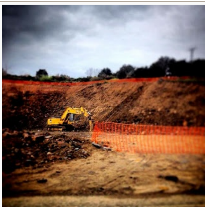
El día que la máquina haga a la máquina: ¿Qué haréis?