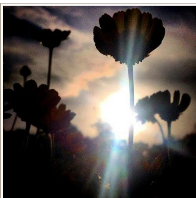
Las flores viven y viven siempre