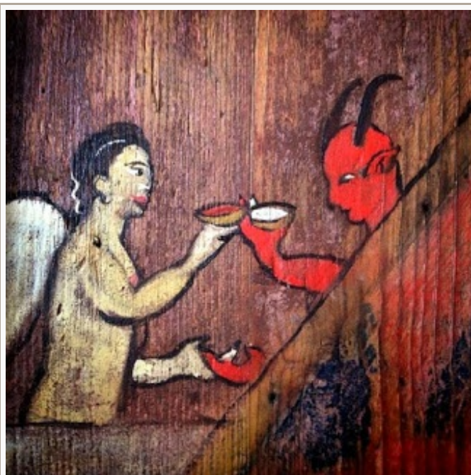
Hay que elegir muy bien el camino que se quiere tomar