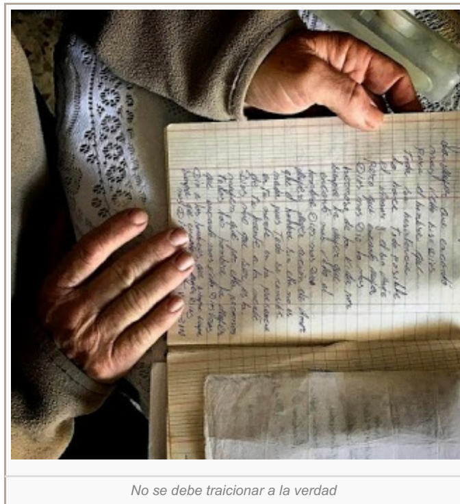
No se debe traicionar a la verdad

Ya no me mates que ya estoy muerto antes de nacer. Pues en la tormenta de mi existencia tú y tus intereses no van conmigo. Pues la vida de un ser humano no tiene precio y tú lo matas antes de nacer. En tus entrañas está ya concebido y por tu comodidad lo matas. Que luego, día a día, nunca ya podrás olvidar (que) abortaste a tu hijo o hija. Pues nunca lo sabrás porque no le diste la oportunidad. Más, lo mataste antes de nacer para así no tener que enfrentarte a lo bello de la vida. Si: lo bello es aquello que nace de tus entrañas. Ya no me mates antes, que ya estoy muerto antes de nacer.