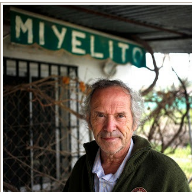
En el pueblo lo conocen como Miyelito

Mientras exista la mentira, siempre habrá que buscar la verdad.