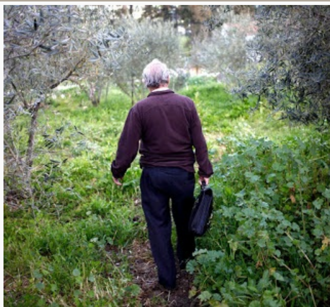
La cartera negra lleva las partituras del tiempo

Las 12 razones para quererte. (Y no es a una mujer, es a mi Dios )