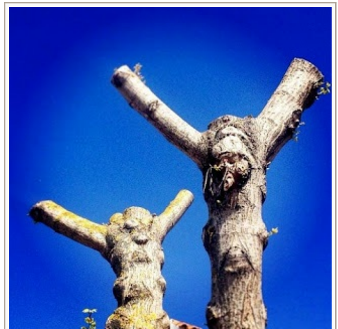
En Andalucía hoy a los árboles los crucifican en primavera